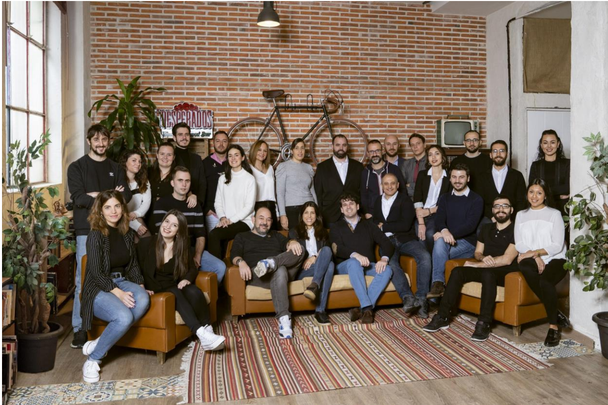
El equipo de Tiko, una de las startups que más dará que hablar en 2020.

13 de febrero de 2020. Vender una casa en apenas una semana, controlar la diabetes con un parche de insulina automático o gestionar todas las finanzas desde el móvil son algunos de los cambios que estas startups han conseguido aplicando la tecnología en diferentes sectores.